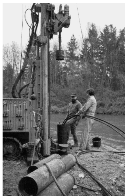
Abb. Geologische Bohrungen in der Saalach