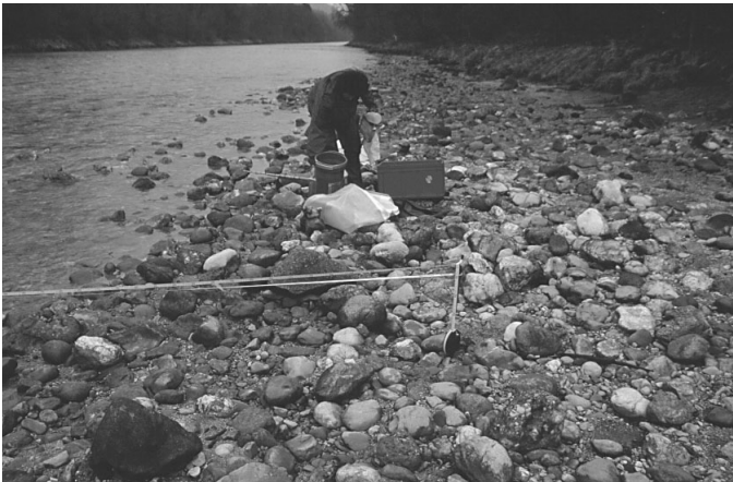
Abb. Gewässerökologische Untersuchungen