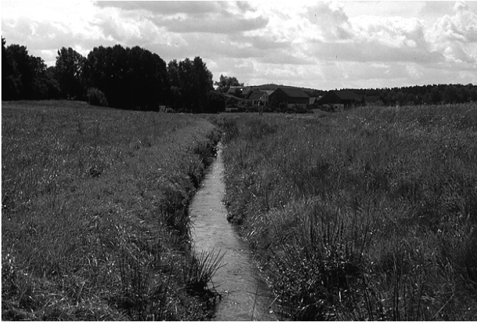
Abb. Begradigter Bach im ländlichen Raum

größten Teil des bayernweiten Gewässernetzes, wie folgender Vergleich zeigt: